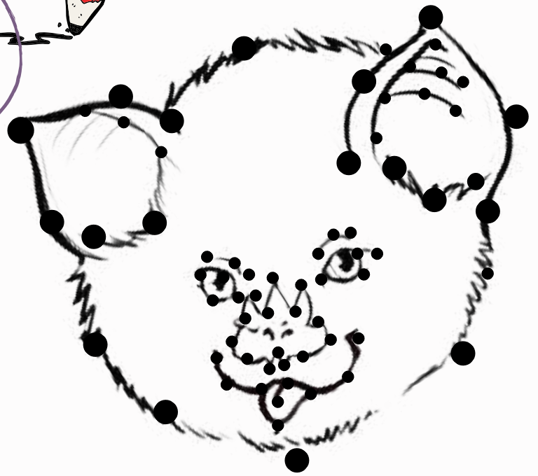
Chauve-souris trident à oreilles courtes de Percival