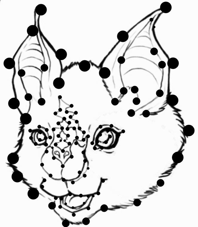
Le Rhinolophe de Geoffroy